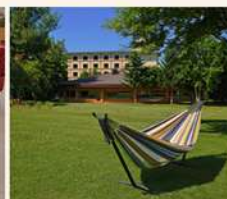
■中庭・パークゴルフ ／Courtyard・ Park golf course