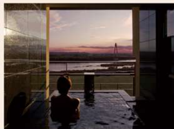
琥珀(こはく)色の湯に身体を浸し、心ゆくまで贅沢な時間を