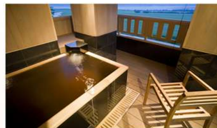
ゆったり過ごしたい、ご家族の記念日に、ちょっと贅沢にモール温泉露天風呂付客室を