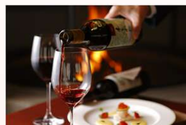
季節のお料理に合わせた厳選ワインもお楽しみください

オープンキッチンスタイルで、お客様から作り手の顔が見える温かみを大切にしています