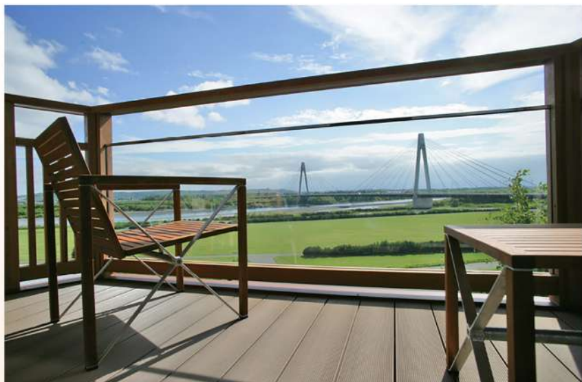
バルコニー付きの客室からは十勝川一帯の風景が楽しめる