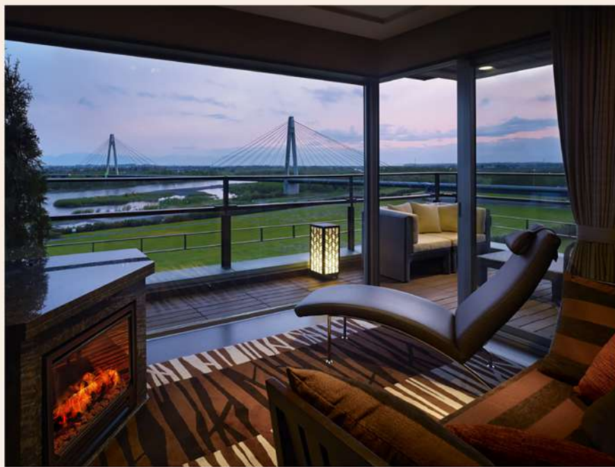
暖炉の柔らかな炎が旅の時間を寛ぎで満たします