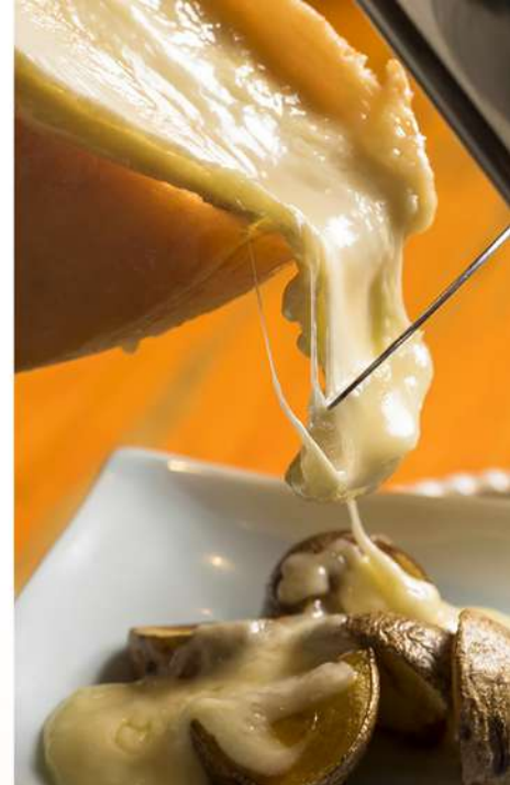
モール温泉水でウォッシュし、熟成した「十勝ラクレットモールウォッシュ」