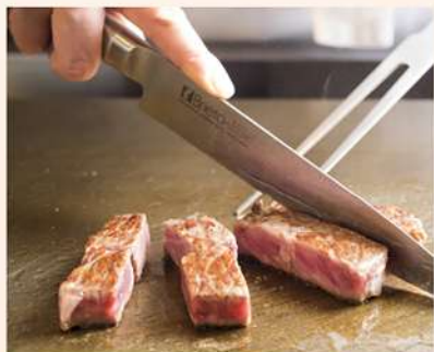
酪農王国・十勝が育む逸品「十勝産黒毛和牛」は柔らかい食感と濃厚な旨み

At "Teppan-yaki Jyuhyou," you will experience seasonal fresh food in each season delivered from field of Tokachi