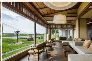
■湯上がりガーデンテラス ／Garden Terrace