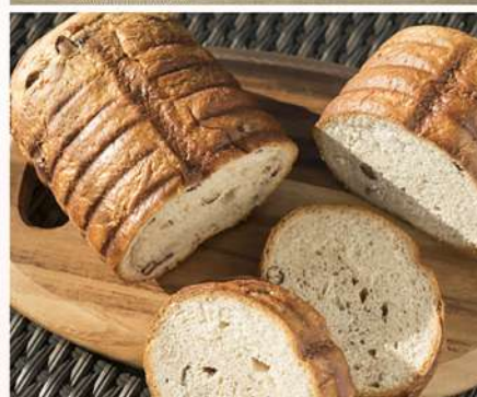
十勝産小麦を使用したホテルメイドの焼きたてパンを毎朝手作りで