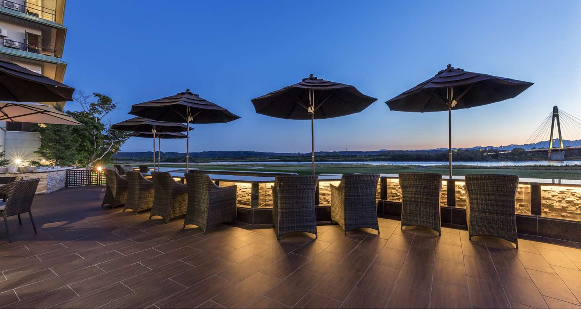
十勝の雄大な風景を眺められる「足湯テラス はるにれ」／Magnificent scenery in Tokachi with a "Footbath Terrace Harunire"