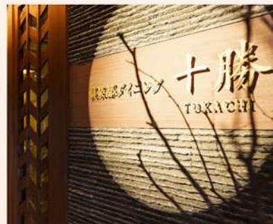
和と洋が融合した洗練された全 10 個室の「倶楽部ダイニング十勝」

Chef grills seasonal vegetables, seafoods, and Japanese black beef from Tokachi in front of you. "Tokachi Wagyu" beef which grows up in dairy farm kingdom, Tokachi, has a soft texture and rich umami.