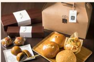
■お土産処 玉手箱・ 十勝川温泉ベーカリー／ Tamatebako Souvenir Shop・ Tokachigawa Onsen Bakery