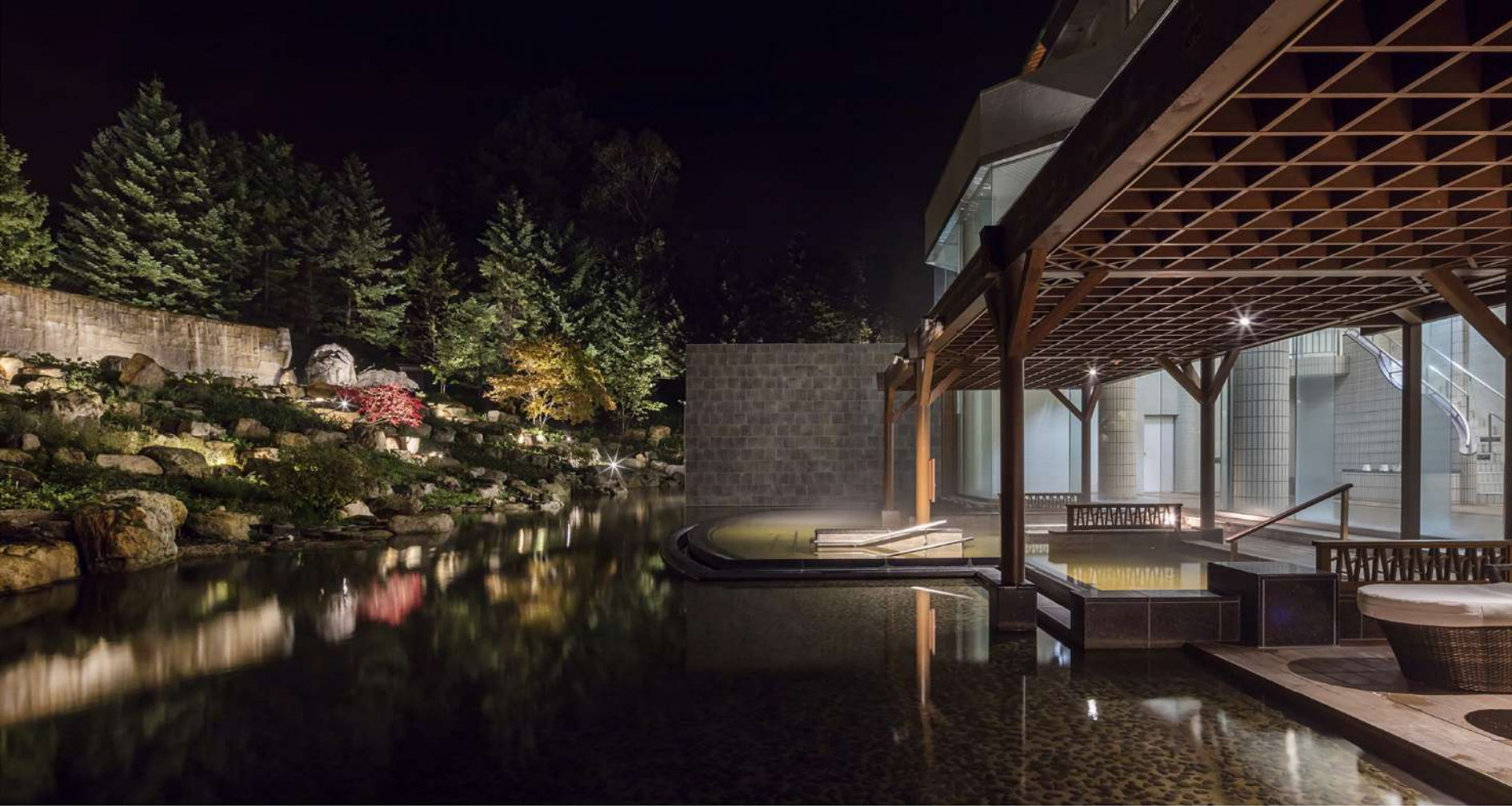
流れる滝の音に癒される庭園露天風呂「森の清流・滝壺の湯」／ Heal your mind with waterfalls in open-air bath called "Mori-no seiryu, Takitsubo-no-yu"