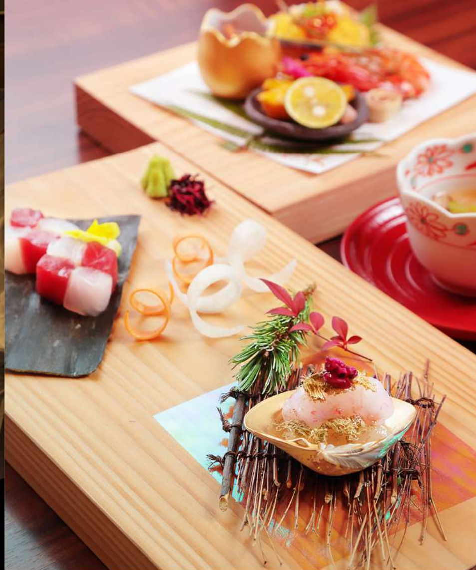
十勝の旬の味覚、総料理長こだわりの四季献立 和食会席膳