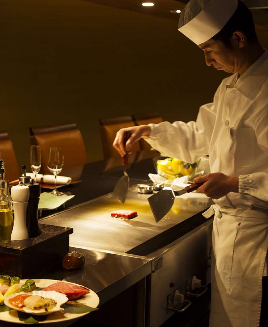
旬野菜、魚介、十勝産黒毛和牛など、贅沢素材を目の前で焼きあげる