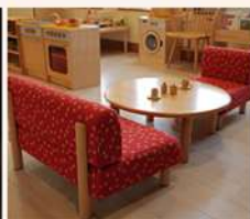
■キッズプレイルーム ／Kids Play Room