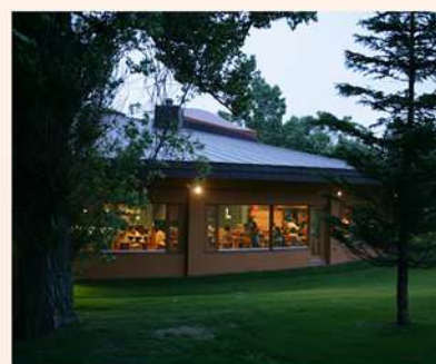
ビュッフェスタイルの「レストラン木もれび」は、大きな窓と緑に囲まれた開放的な空間

オープンキッチンスタイルで、お客様から作り手の顔が見える温かみを大切にしています